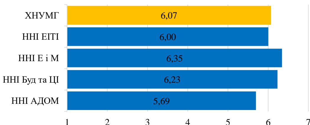
Рис. 2.2 – Усереднений бал оцінок щодо якості освітніх програм, «Опитування бакалаврів-випускників останнього року навчання щодо якості освітніх програм 2023/2024 н.р.»