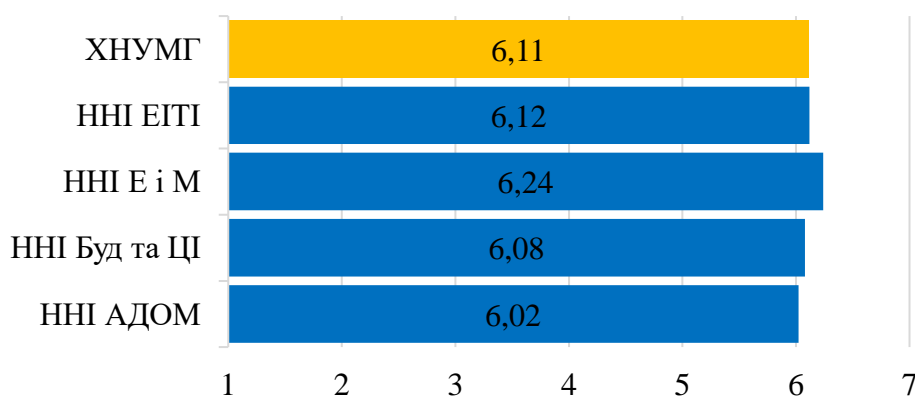
Рис. 2.2 – Усереднений бал оцінок щодо якості освітніх програм, «Опитування бакалаврів-випускників останнього року навчання щодо якості освітніх програм 2022/2023 н.р.»